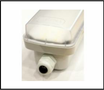
Bouchon presse-étoupe M16. divers PA noir M-16 - BPM-21 (60000006)

Date de création de la carte: 08 janvier 2025