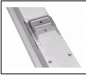
regulowane uchwyty / adjustable handles / einstellbare Halterungen