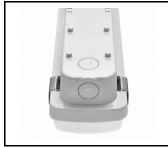
wybór miejsca zasilania / choosing a place of power supply / Stromversorgungsanschluss von mehreren Seite möglich