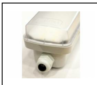
Bouchon presse-étoupe M16. divers PA noir M-16 - BPM-21 (60000006)

Date de création de la carte: 13 mars 2025