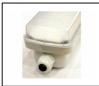
Bouchon presse-étoupe M16. divers PA noir M-16 - BPM-21 (60000006)

Date de création de la carte: 08 janvier 2025