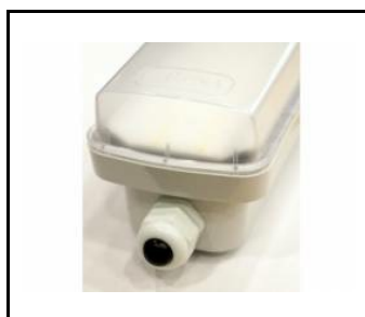
Bouchon presse-étoupe M16. divers PA noir M-16 - BPM-21 (60000006)

Date de création de la carte: 19 août 2024