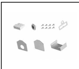
LINEA 2 LED - kit de verrouillage (966323)

Date de création de la carte: 19 mars 2025