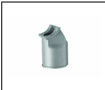
support de montage 78 mm (UL00229)

Date de création de la carte: 05 février 2024