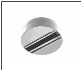
Support en saillie blanche EXPO SYSTEM LED (255113)