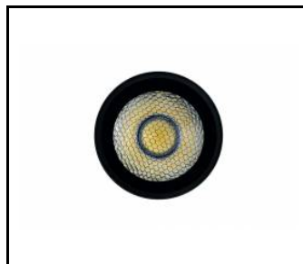
Nid d'abeille LED EXPO SYSTEM (255120)

Date de création de la carte: 11 juillet 2023