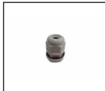
Divers presse-étoupe gris M20 * 1.5 IP68 (16000507)