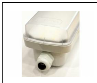
Bouchon presse-étoupe M16. divers PA noir M-16 - BPM-21 (60000006)

Date de création de la carte: 08 janvier 2025