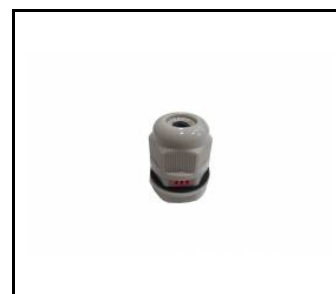
Divers presse-étoupe gris M20 * 1.5 IP68 (16000507)