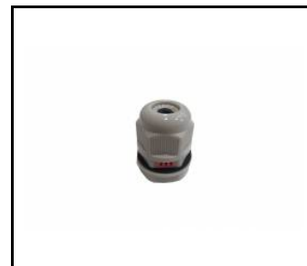
Divers presse-étoupe gris M20 * 1.5 IP68 (16000507)