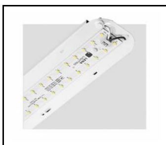
TYTAN MULTI LED 1150mm 5000-8700lm 840 - module d'éclairage (358944)