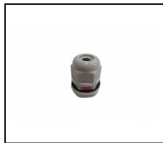
Divers presse-étoupe gris M20 * 1.5 IP68 (16000507)