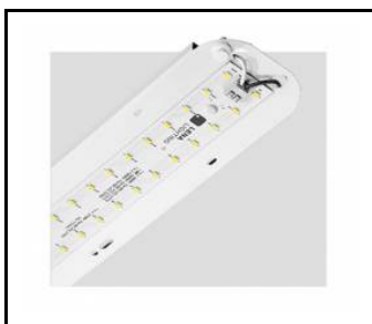
TYTAN MULTI LED 1150mm 2500-4300lm 840 - module d'éclairage (358937)