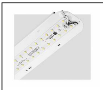
TYTAN MULTI LED 1450mm 3150-5450lm 840 - module d'éclairage (358951)