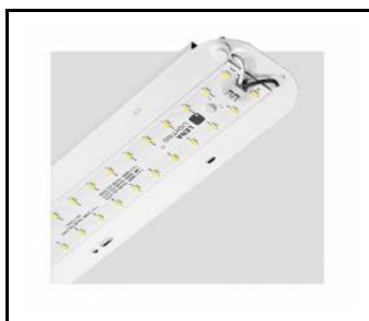
TYTAN MULTI LED 1450mm 3150-5450lm 840 - module d'éclairage (358951)