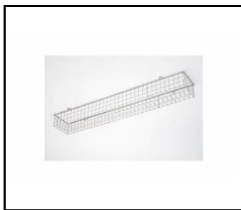
TYTAN LED. ATLAS LED - grille de protection 1152mm (907913)