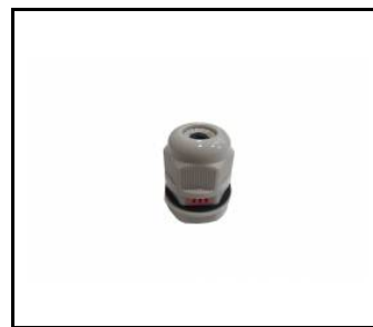
Divers presse-étoupe gris M20 * 1.5 IP68 (16000507)