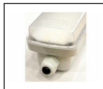
Bouchon presse-étoupe M16. divers PA noir M-16 - BPM-21 (60000006)

Date de création de la carte: 08 janvier 2025