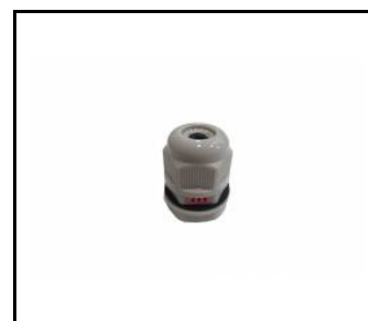
Divers presse-étoupe gris M20 * 1.5 IP68 (16000507)