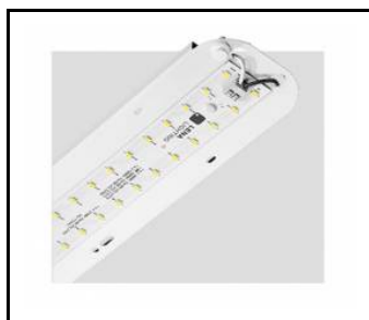
TYTAN MULTI LED 1150mm 2500-4300lm 840 - module d'éclairage (358937)