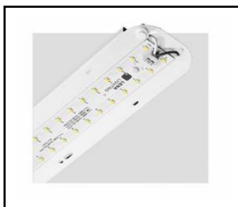
TYTAN MULTI LED 1150mm 5000-8700lm 840 - module d'éclairage (358944)