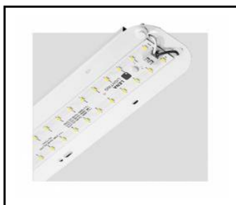
TYTAN MULTI LED 1150mm 5000-8700lm 840 - module d'éclairage (358944)