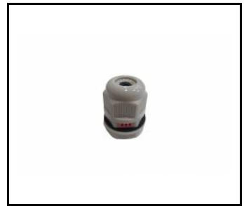
Divers presse-étoupe gris M20 * 1.5 IP68 (16000507)