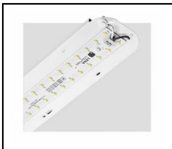
TYTAN MULTI LED 1150mm 2500-4300lm 840 - module d'éclairage (358937)