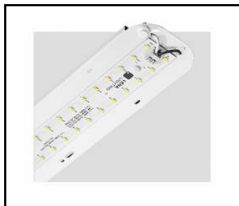
TYTAN MULTI LED 1150mm 5000-8700lm 840 - module d'éclairage (358944)