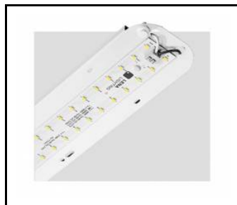
TYTAN MULTI LED 1450mm 3150-5450lm 840 - module d'éclairage (358951)