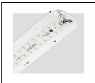
TYTAN MULTI LED 1450mm 3150-5450lm 840 - module d'éclairage (358951)