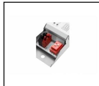
tytan multi led