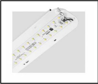
TYTAN MULTI LED 1150mm 2500-4300lm 840 - module d'éclairage (358937)