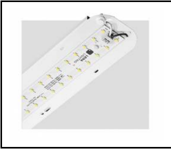
TYTAN MULTI LED 1150mm 5000-8700lm 840 - module d'éclairage (358944)