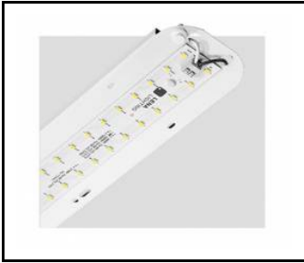
TYTAN MULTI LED 1450mm 3150-5450lm 840 - module d'éclairage (358951)