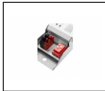
tytan multi led