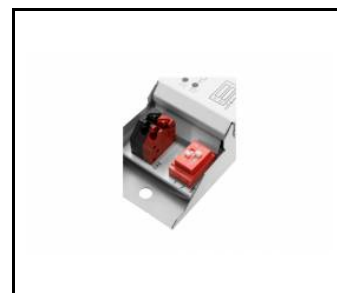
tytan multi led