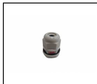
Divers presse-étoupe gris M20 * 1.5 IP68 (16000507)