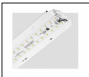
TYTAN MULTI LED 1150mm 2500-4300lm 840 - module d'éclairage (358937)