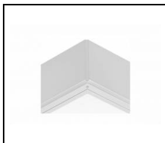
COMPACT LED EVO N IP65