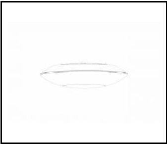
CAPELLA LED EDGE

FICHE DÉTAILLÉE DE PRODUIT DÉTAILS TECHNIQUES