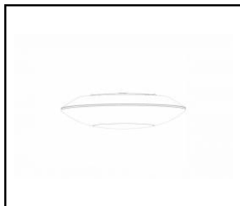
CAPELLA LED EDGE

FICHE DÉTAILLÉE DE PRODUIT DÉTAILS TECHNIQUES