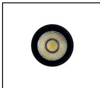
Nid d'abeille LED EXPO SYSTEM (255120)

Date de création de la carte: 10 janvier 2025