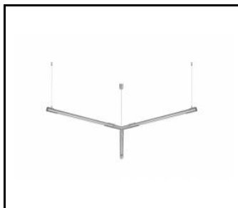
Connecteur étoile TUBE LED EVO système (266492)

Date de création de la carte: 16 septembre 2021