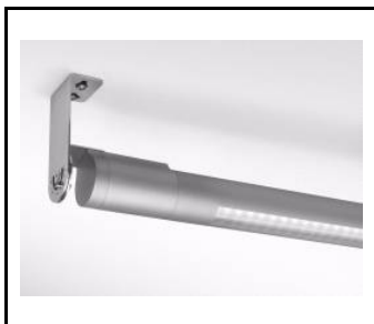
Tube LED EVO Support de montage réglable +/- 100 degrés. (267604)