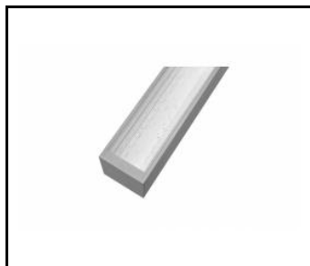
SMART LED EVO - PRZESŁONA PRM

FICHE DÉTAILLÉE DE PRODUIT DÉTAILS TECHNIQUES