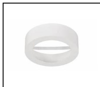
BOITIER ROND FRAGA 6W / 11W. NECTRA 5W / 7W / 7W IP44 (059841)