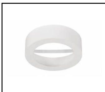
BOITIER ROND FRAGA 15W. NECTRA 9W / 9W IP44 (059858)