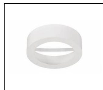
BOITIER ROND FRAGA 6W / 11W. NECTRA 5W / 7W / 7W IP44 (059841)