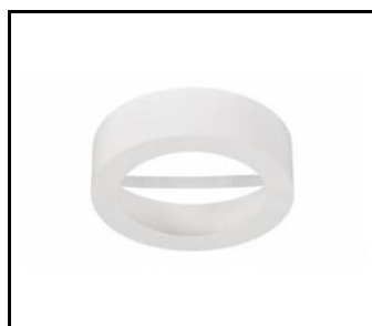
BOITIER ROND FRAGA 15W. NECTRA 9W / 9W IP44 (059858)