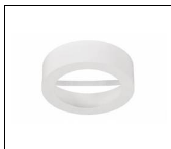
BOITIER ROND FRAGA 15W. NECTRA 9W / 9W IP44 (059858)