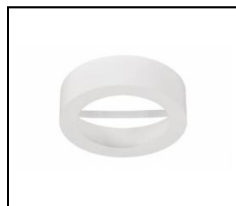
BOITIER ROND FRAGA 6W / 11W. NECTRA 5W / 7W / 7W IP44 (059841)