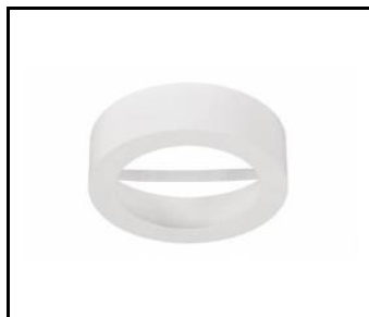
BOITIER ROND FRAGA 15W. NECTRA 9W / 9W IP44 (059858)