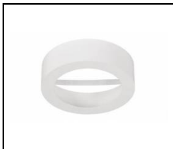
BOITIER ROND FRAGA 6W / 11W. NECTRA 5W / 7W / 7W IP44 (059841)