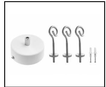
Suspension Coria set 1 fi 100 noir far (556678)