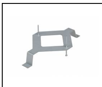
CORAL - support pour montage encastré (229763)

Date de création de la carte: 10 septembre 2021