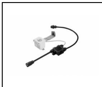
OCULUS LED - Détecteur de mouvement RCR / PIR DALI (963674)