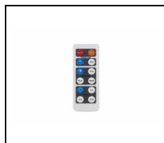
Pilot zdalnego sterowania do czujnika ruchu WSEL438 HD01R. (WSEL438)