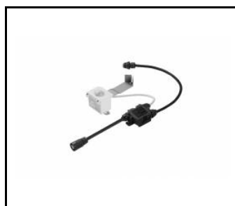
OCULUS LED- czujnik ruchu (967047)