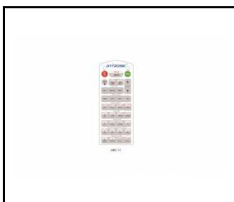
Pilot zdalnego sterowania do czujnika PIR (WSEL415)