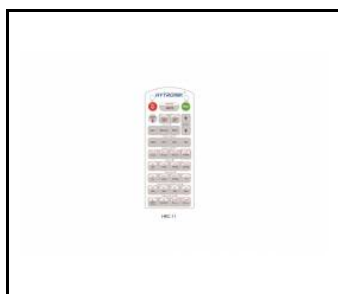
Pilot zdalnego sterowania do czujnika PIR (WSEL415)