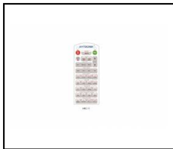
Pilot zdalnego sterowania do czujnika PIR (WSEL415)