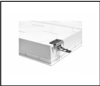
COMPACT LED EVO Clip pour plafonds KG (4 pcs) / Supports de montage pour plaques de plâtre (4 pcs) (630033)