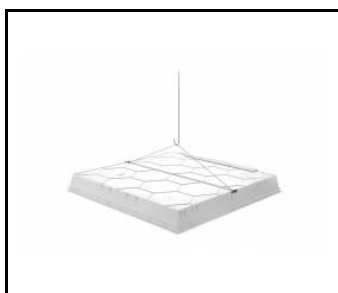
COMPACT LED EVO Protection de montage (plafond modulaire) / Suspension de sécurité (plafond modulaire) (904349)