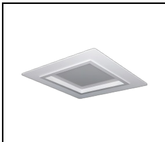
Ramka kwadrat 220 do SQ160 biała RAL9016 struktura (998942)