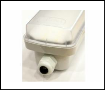
Blindstopfen für M16- Kabelverschraubung verschiedene PA schwarz M-16 – BPM-21 (60000006)

Erstellungsdatum der Karte: 08 Januar 2025