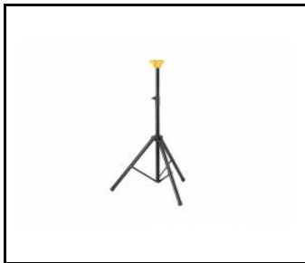
Stojak Future Stand z systemem Click Head (000737)