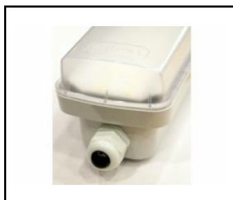
Blindstopfen für M16-Kabelverschraubung verschiedene PA schwarz M-16 – BPM-21 (60000006)

Erstellungsdatum der Karte: 19 Juli 2024