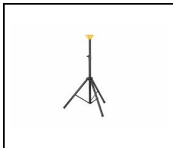
Stojak Future Stand z systemem Click Head (000737)