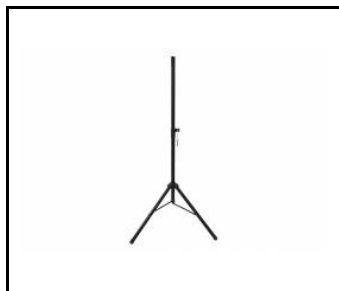
Standard tripod (000720)