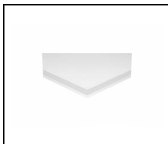
PLANO LED EVO DETAL 2