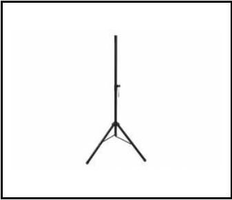
Standard tripod (000720)

Erstellungsdatum der Karte: 17 September 2020